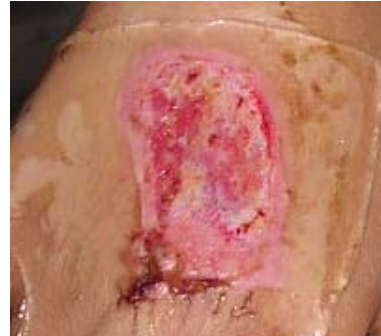
Hình 2: Đắp màng hydrogel lên vết thương mất da